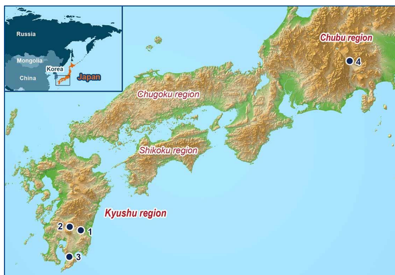
図1 ゴキブリ卵鞘圧痕を検出した縄文遺跡の位置

(1 : 本野原遺跡 (宮崎県宮崎市) , 2 : 上田代遺跡 (宮崎県えびの市) , 3 : 小牧遺跡 (鹿児島県鹿屋市) , 4 : 堰口遺跡 (山梨県北杜市) )