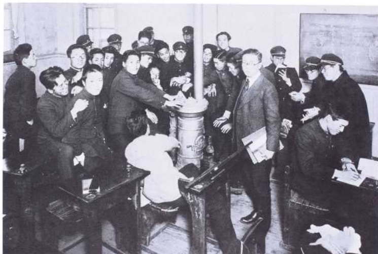
五 在堂中ストーブを囲んで