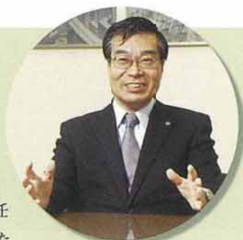
熊本大学長 谷口 功

是非、同窓の方々、先輩後輩の皆様お誘い合わせの上、「熊大」にお集まりいただき、輝かしい歴史と伝統の中で、明日に向かって躍動する母校を感じていただければ幸いです。